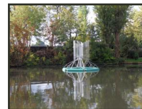
Hydrolienne sur le Lac Nord Enghien-les-Bains

Une participation à la valorisation du patrimoine biologique de l'eau. Il assure un suivi de la qualité des eaux du Lac d'Enghien, exutoire des eaux pluviales d'une partie du territoire syndical.